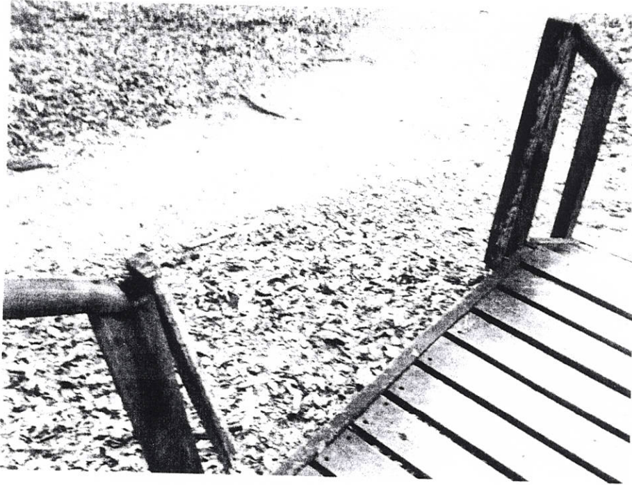
Fig.6: Observación del estado de la infraestructura

Se observan el estado de la infraestructura y se identifican necesidades de mantenimiento o renovación.